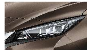
古銅金 [CAN] Bronze Metallic