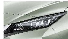
淨翠綠 [KBR] Spring Cloud