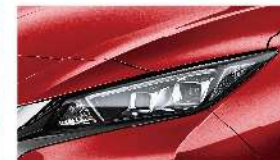
魅艷紅 [NAJ] Magnetic Red