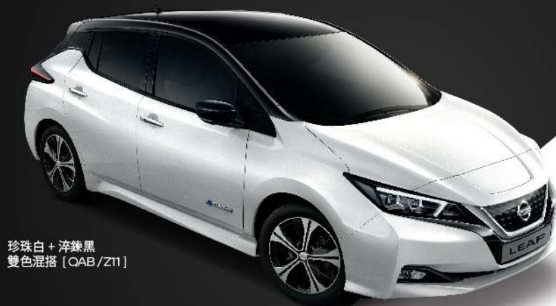
珍珠白 + 淬鍊黑 雙色混搭 [QAB/Z11]