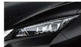
淬鍊黑 [Z11] Black Metallic