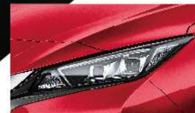
躍動紅 [Z10] Flame Red