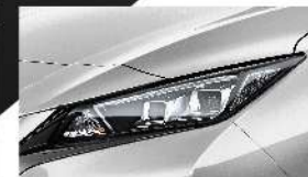
刀刃銀 [KYO] Blade Silver