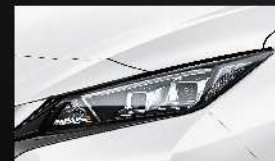
勁月白 [326] Arctic Solid White