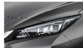
電光灰 [KAD] Gun Metallic