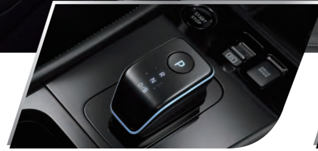
鋼琴烤漆電子排檔桿

科技內裝 寧靜駕馭 / e-POWER專屬電子排檔桿與智慧全彩數位儀錶板介面，打造輕奢科技質感。全車靜音工程再升級，搭配舒適真皮座椅，擋得住車外喧鬧，撐得起舒適嚮往。428L後艙大空間，滿足各種裝載需求，放肆暢玩世界。