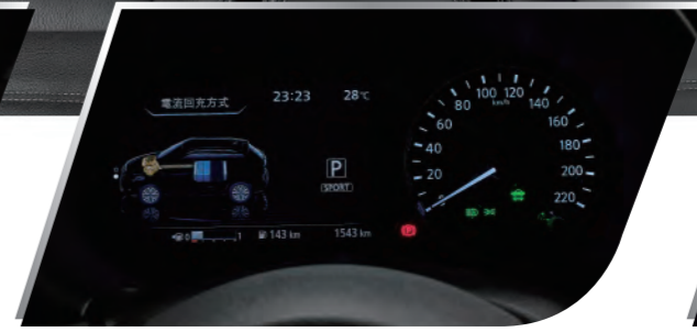
7吋數位液晶儀錶板(e-POWER Type)