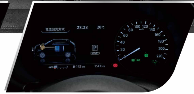
7吋數位液晶儀錶板(e-POWER Type)