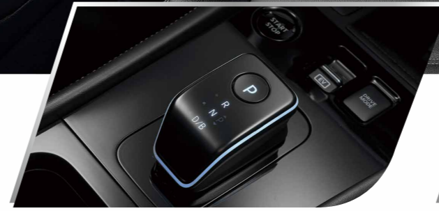
鋼琴烤漆電子排檔桿